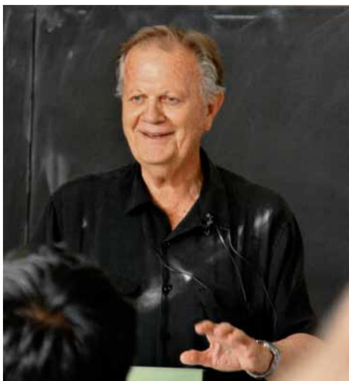
Hayden White (Stanford University) beim Abendvortrag der Graduiertenkonferenz.

Gelegenheit zur Präsentation ihrer eigenen Arbeiten nutzen wollten. Mit zwölf Panels zu verschiedenen Aspekten von Krisen u.a. in der Konstruktion von Identität(en), politischen Auseinandersetzungen im In- und Ausland, und der vielfältigen Nachwirkungen des 11. September in Kultur und Literatur, konnte die Ambivalenz von Krisen als einem prekären und gleichzeitig emergenten Zustand heraus gestellt werden.