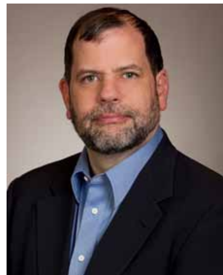
Tyler Cowen zu Gast an der GSNAS

Promovierenden und Lehrenden des John-F.-Kennedy-Instituts, der Graduate School und auswärtigen Gästen. Tyler Cowen sprach am 22. Juni über die Frage „Does the American Economic Model Have a Future?“, unter welcher er verschiedene, kontroverse Lösungsmodelle für die internationale Wirtschaftskrise diskutierte. Hayden White hielt am 6. Mai einen Vortrag mit dem Titel „The Practical Past“, in welchem er über die Veränderlichkeit der Grenzen zwischen Geschichtsschreibung und literarischer Erzählung sprach.